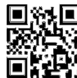
สแกนคิวริ์ดไอ โครงการ “อลิอันซ์ อยุธยา พาน้องเที่ยวบางกอก”